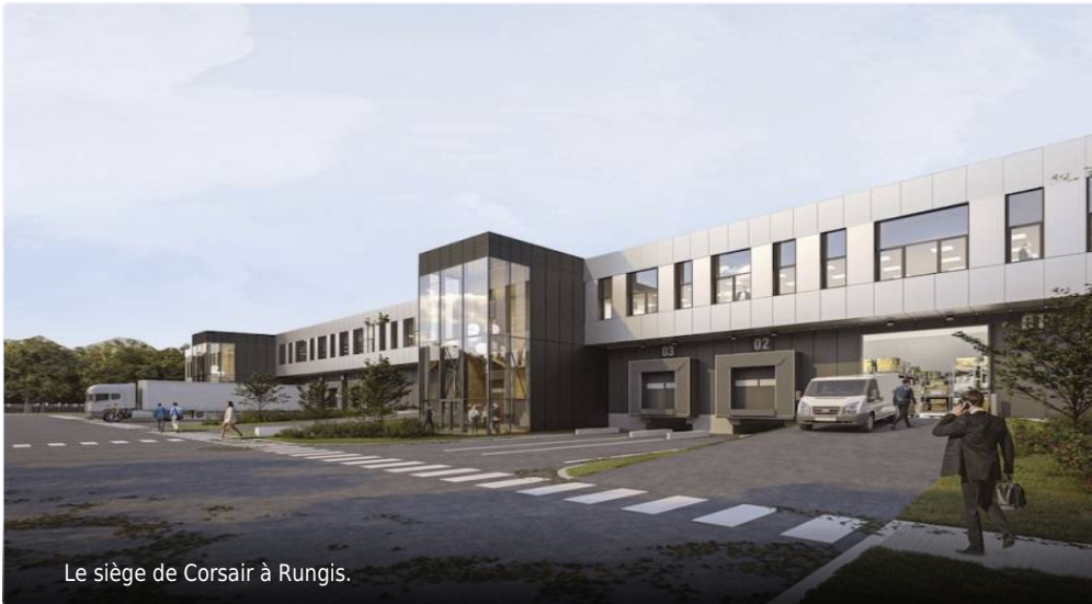
Le siège de Corsair à Rungis.

Publié le 22 oct. 2021 à 16:42, mis à jour le 22 oct. 2021 à 17:52 - 3 conseils